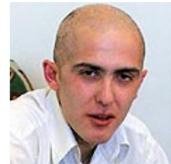
מילשטיין. תביעה נגד צה"ל